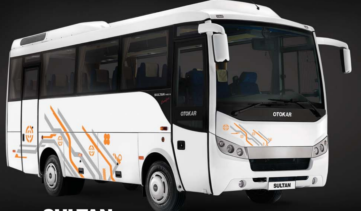
SULTAN 140S Comfort

Ön ve arka tasarımında kullanılan modern çizgiler, yenilenen motor ve bagaj kapakları; yuvarlak hatlı çamurluk ve yeni arka reflektör ile tamamlanıyor.